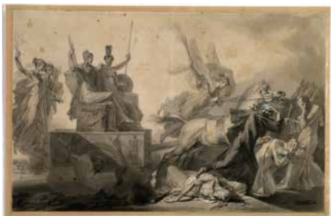
La République Française