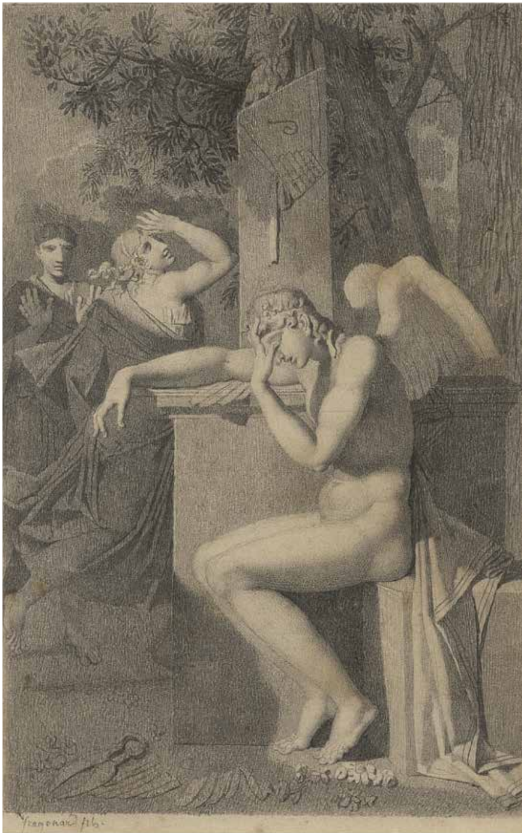
L'Amour pleurant la perte de ses ailes