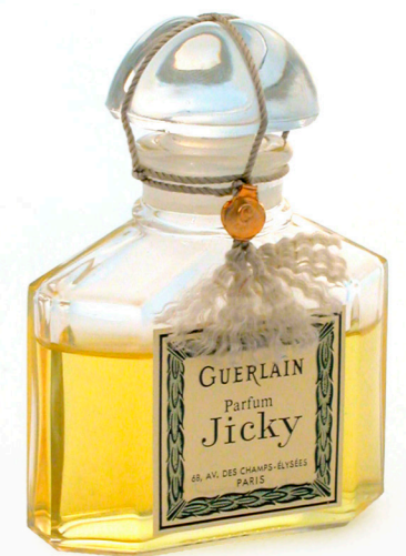
Jicky - Paris - Guerlain - 1889