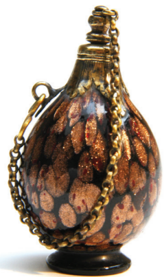
Flacon en cristal de Murano - Venise - 17 e s. base et bouchon en vermeil.

Les croisades et la découverte du Nouveau Monde apportent pourtant de nouvelles matières premières. On fait appel au pouvoir des plantes, épices et aromates, considéré comme une preuve de l'amour de Dieu, face aux épouvantables odeurs associées aux grandes épidémies. Alors que le mysticisme et le symbolisme triomphent, on attribue aux plantes des vertus thérapeutiques en fonction de leur couleur et de leur forme.