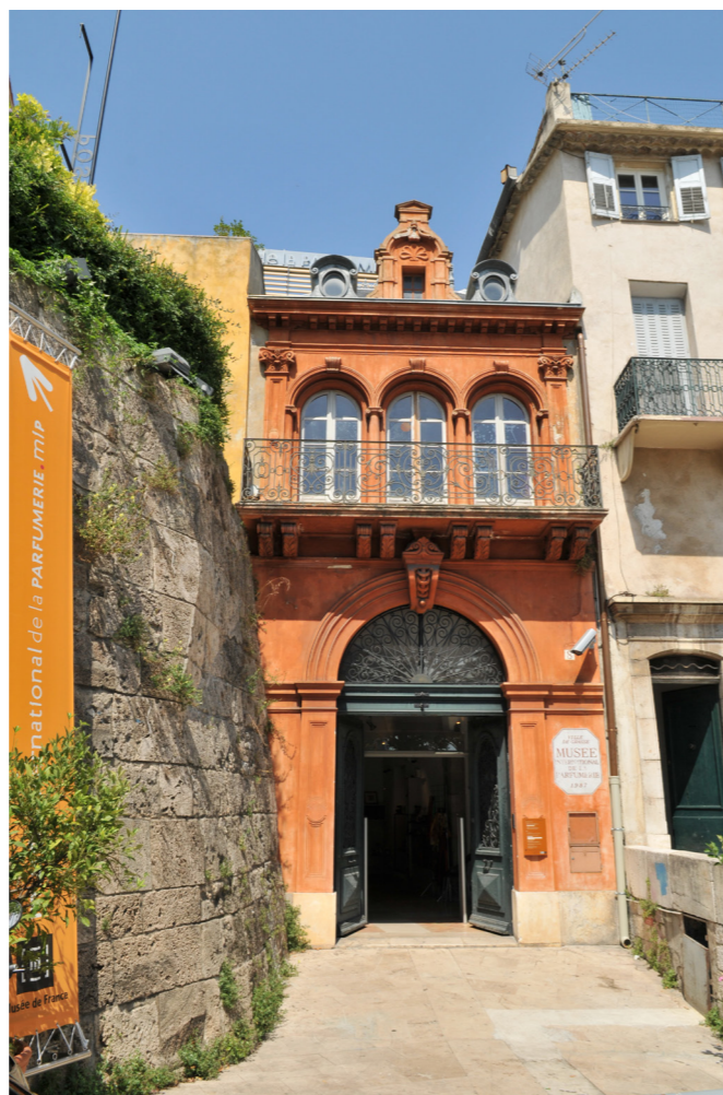
Façade de la parfumerie Hugues-Ainé

C'est le sens du réaménagement du musée réalisé en 2018 et 2019. Le musée se veut le pôle de convergence de tout ce qui s'est passé, de tout ce qui se passe et de tout ce qui se