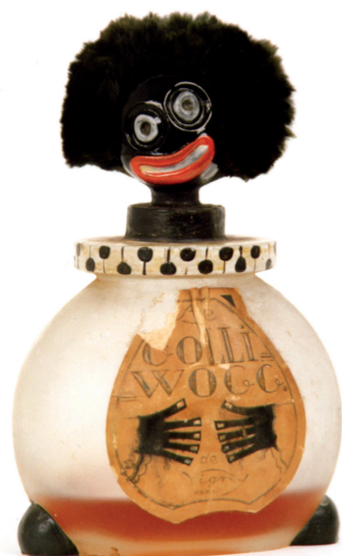
Flacon Golli Wogg - Vigny - Verre - France

Elle intervient aussi dans l'amélioration des installations du musée : éclairage, achat de mobilier et de matériels techniques.