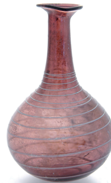
Flacon piriforme - II e III e après. J.C. - Syrie - Verre soufflé.

Sous la domination de Jules César, le culte du corps, dont le parfum devient un accessoire indispensable, atteint son apogée. Dans cette société polythéiste, on va jusqu'à associer à chaque divinité un parfum. Si Rome en démocratise l'usage, sans pourtant innover en termes de créativité, elle révolutionne le transport et le commerce ; plus léger, le verre soufflé ou moulé est imperméable aux odeurs et détrône ainsi les contenants en terre.