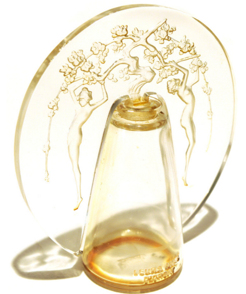
Leurs âmes - Paris - Lalique