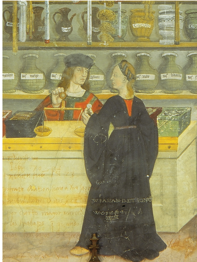
Boutique de l'apothicaire

C'est le règne du jardin des simples, la célèbre « armoire à pharmacie » médiévale que tiennent les moines.