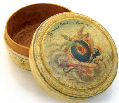
Boîte bergamote - Écorce de bergamote - France - papier peint et vernis - 18 e s

Le centre de documentation a été développé et est aisément accessible aux chercheurs.