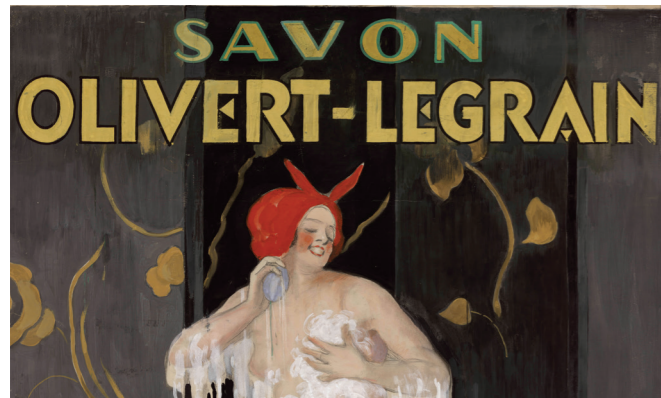
Affiche Savon Olivert-Legrain - L. Capiello - 1920

La parfumerie, au sens large du terme, constitue l'un des plus importants phénomènes de société, depuis la protohistoire, dans toutes les civilisations, quel que soit le contexte social, politique ou religieux. Depuis plus de cinq millénaires, elle a donné naissance à des milliers d'objets dans des matériaux précieux ou plus humbles, de toutes formes et toutes couleurs. Elle a bien sûr suscité de nombreuses collections privées. Mais jamais, avant l'ouverture du Musée International de la Parfumerie, n'avait existé la volonté de créer un établissement public consacré à la sauvegarde de ce patrimoine. Le savon, le maquillage, les cosmétiques, sont indissociables de ce que l'on entend aujourd'hui par parfumerie, c'est-à-dire la parfumerie alcoolique de luxe.