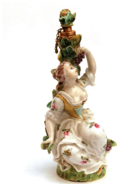
Flacon figurine en forme de jeune femme cueillant une grappe de raisin - Chelsea Porcelaine - 18 e s