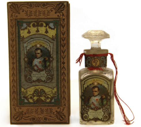
Étoile de Napoléon - Paris - Vville - 19 e s.

Après le foisonnement d'une création débridée et élitiste, la société de la seconde moitié du XX e siècle connaît une mutation majeure : les stratégies commerciales de la parfumerie s'adressent à toutes les classes sociales, entraînant une baisse du prix de vente et donc du prix de revient. Les lancements se multiplient, pariant sur le succès. Les cycles des modes olfactives et des tendances s'accroissent au gré du marketing et de consommateurs avides de nouveautés. L'impératif de la nouveauté n'a jamais été aussi pressant. À quelques exceptions près, la parfumerie est passée de l'exceptionnel à l'usuel et de l'hyper sélectif à la grande masse. L'odorat, longtemps négligé, est de plus en plus sollicité : aliments, produits d'entretien, intérieur des voitures, bureaux et lieux publics. Et si le nombre de ces odeurs visent à renforcer le plaisir, certaines ont pour mission de susciter l'envie et de déclencher l'achat.