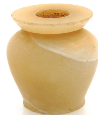
Pot à onguent - Égypte, Moyen Empire - Albâtre taillé.

On attribue au mot parfum une origine antique ; perfumare , signifierait « par la fumée », élément nécessaire à son utilisation première en fumigations sacrées, médicinales, ou rituelles. Arôme, effluve, fragrance... une petite histoire du sacré et de la séduction.