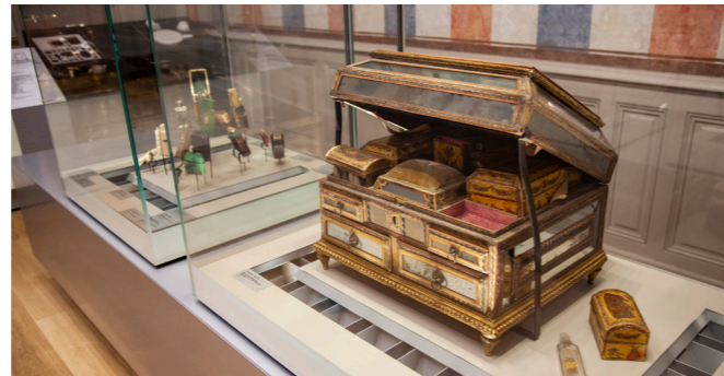
Coffret de toilette - 18 e siècle - Venise, Bois, verre, carton, tissu, métal Musée International de la Parfumerie, inv. 94 48

Grasse a voulu être la première à créer un Musée International de la Parfumerie. La ville a présenté un projet scientifique élaboré, servi par une tenace volonté collective de le faire aboutir.