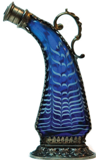
Flacon à parfum en forme de poire à poudre - Allemagne - Début 18 e s. - Cristal, base et bouchon en vermeil.