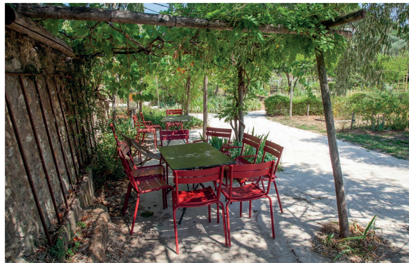
Pergola aux Jardins du MIP

❖ La pergola des rosiers : Réalisée en métal et osier, elle fait référence aux paniers des cueilleuses.