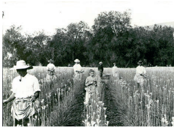
Récolte de tubéreuse, début du XX ème siècle, Grasse

Pour des raisons économiques liées au coût de la main d'oeuvre et à la mondialisation des activités, l'exploitation et la présence de champs de fleurs à parfum ont presque disparu sur le territoire de Grasse. Il est donc fondamental pour le Musée International de la Parfumerie, à travers les Jardins du MIP, de maintenir cette tradition, ce savoir-faire, inscrit au Patrimoine Culturel Immatériel de l'Humanité auprès de l'UNESCO.