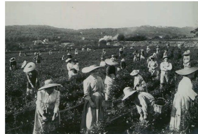
Récolte du jasmin, début du XX ème siècle, Grasse

Entre les années 1970 et 1980, on assiste à un développement de l'immobilier au détriment des terrains agricoles : les cultures de jasmin se déportent alors en Égypte, dans le delta du Nil, puis en Inde du Sud. Aujourd'hui, ces deux origines assurent à parts sensiblement égales 90% de la production mondiale.