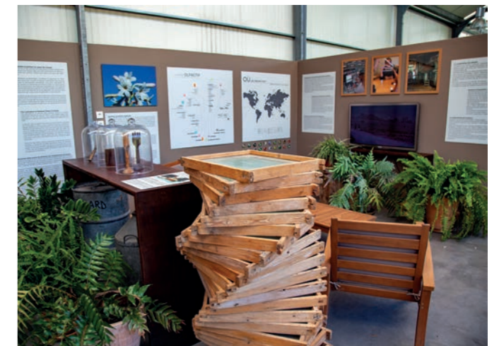
La serre des Jardins du MIP

Gilles Sensini, architecte, commente : « La serre se présente comme une barrière qui attise la curiosité du visiteur ». Elle permet de mettre en scène la séquence d'entrée dans les jardins pour une immersion dans une ambiance propice à une expérience particulière. Cette barrière fonctionne comme un passage entre l'univers urbain et le paysage collinaire. Greffer une extension contemporaine sur une bastide traditionnelle n'est pas simple car il est nécessaire que la greffe prenne dans le corps social de son patrimoine. La serre rappelle la culture agricole de la région et s'imbrique facilement dans le paysage local ».