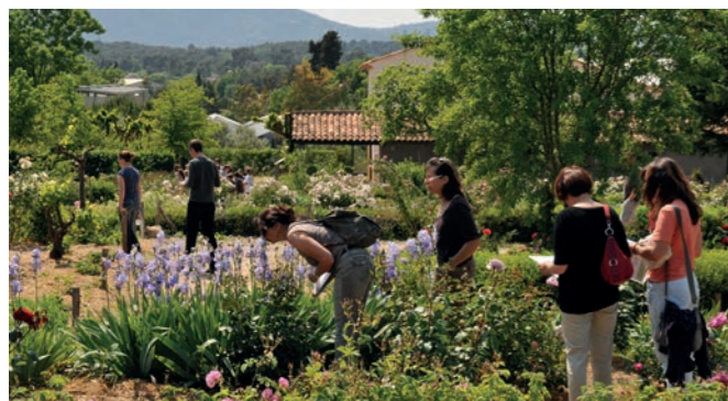
Les Jardins du MIP, Iris de Florence en fleur

La « Bastide du Parfumeur » a été créée dans le but de sensibiliser le public le plus vaste à la mémoire de la culture de plantes à parfum du Pays de Grasse. Ce projet, exclusivement orienté sur les différentes problématiques liées à l'agriculture locale, accorde une place essentielle au développement durable et au patrimoine matériel et immatériel du Pays de Grasse.