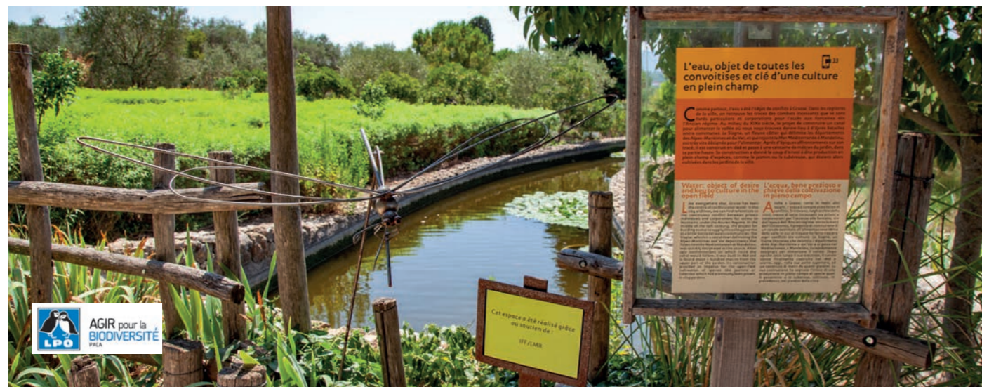
Bassin de rétention d'eau, Jardins du MIP