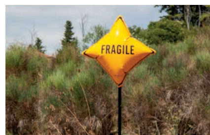
Free Figures, JMIP, 2019